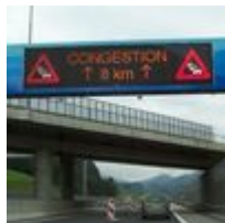
Wechselverkehrszeichen WVZ LED