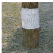
Farbe für Bäume