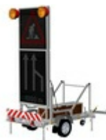
Fahrbare Vorwarntafeln LED