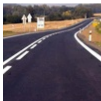
Farben und Plastiken für Strassenmarkierung