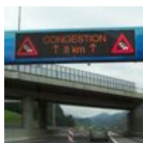
Wechselverkehrszeichen WVZ LED